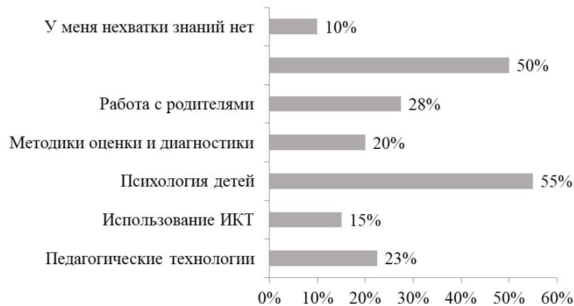
Рисунок 5 - Результаты анкетирования сотрудников МБОУ гимназия «Эврика» им. В.А. Сухомлинского, г. Анапа по вопросу областей профессиональных дефицитов DOI: https://doi.org/10.60797/PED.2026.12.4.5

На основе приведенных данных на 2025-2026 учебный год запланировано проведение ряда мероприятий (табл. 1). Мероприятия направлены на реализацию таких педагогических условий как: - вовлечение педагогов в деятельность профессиональных обучающихся сообществ; - создание ценностно-ориентированной образовательной среды; - психолого-педагогическое сопровождение педагогов.