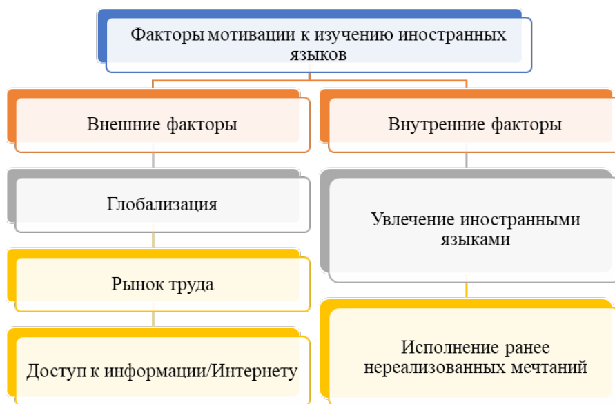
Рисунок 2 - Факторы, формирующие мотивацию к изучению иностранных языков DOI: https://doi.org/10.18454/PED.2023.2.5.2

В группу факторов, формирующих мотивацию к изучению иностранных языков, входят внешние и внутренние факторы (рисунок 2).